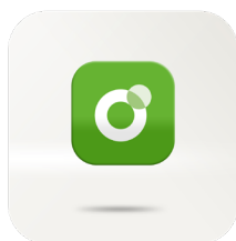
Paxton Solo app